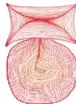
Spiral flower flower / impresión numérica. 1x50 cm. 2012 madrid